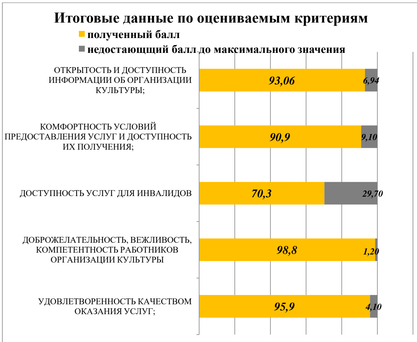
График 2. Итоговые оценки по критериям по региону в целом (вес каждого критерия в баллах).

На Графике 2. приведен вес в баллах каждого критерия.